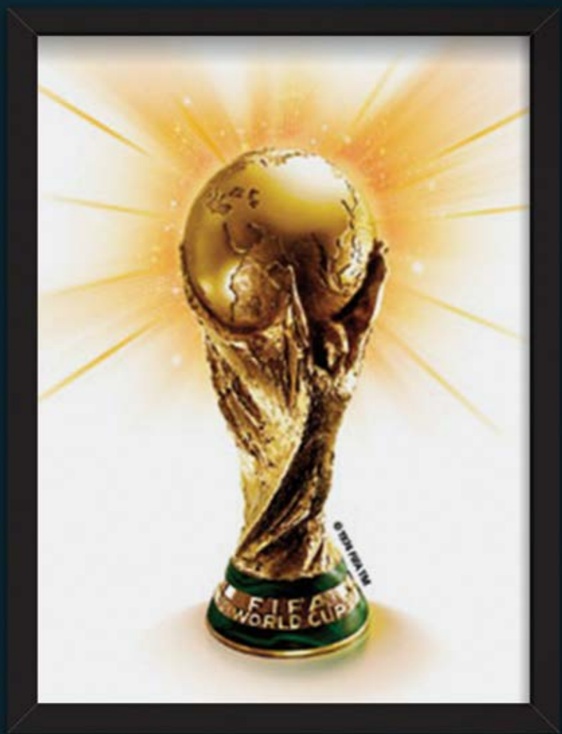
TROFÉU DA COPA DO MUNDO DA FIFA